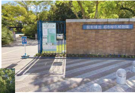
▲ 服部緑地 都市緑化植物園 正門（東門）

都市緑化植物園は、服部緑地東南端の飛び地にあります。近隣地域の愛好者には評判が高く、ネットで検索すると多くの記事で紹介されています。