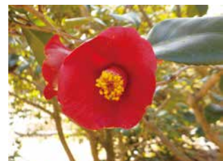
ツバキ (2022年 2月) (黒潮 クロシオ)