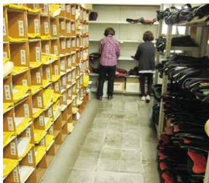
カバンに書類等が大分もどった

仕事の感想は？ ● 昼からの就業で時間も短い。家事用事ができて主婦には有難い。 ● 老いると足腰が弱ったり、げたりもするので健康にもよい。 ● メンバーがいいのでチームワークや連絡もスムーズ。 ● 気安く交代できて助かっている。