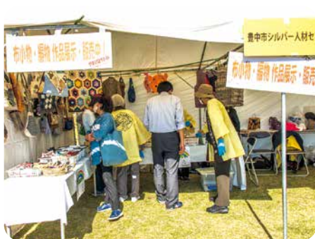
編み物・布小物 作品展示販売