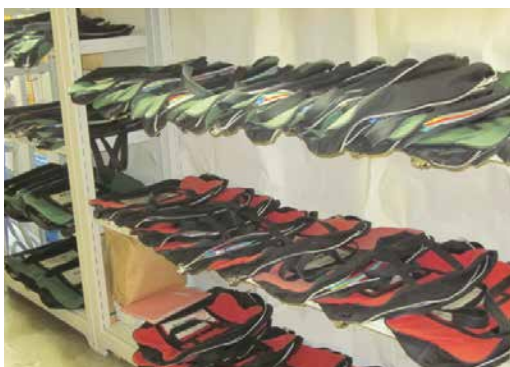
書類等を取り出したカバン

就業日は、土日祝を除く毎日。就業時間は、14時30分～17時15分（含む休憩15分） 2人就業で5人の女性会員がローテーションで働いています。就業回数は、1週平均2回位。