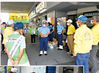
啓発グッズの配布