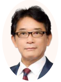
豊中市長 長内 繁樹