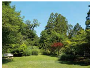
園内 (2022年 6月)