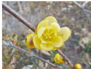
ロウバイ (2022年 1月)