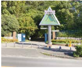
◀ 西門（最寄りバス停 寺内一丁目）

以前は交通手段に制約がありました。が、一昨年に曾根・緑地公園駅に接続する路線バスの運行が開始されたことで、かなり訪ねやすくなりました。有料施設で、その分、落ち着いて園内の花と緑のやすらぎの空間を満喫で