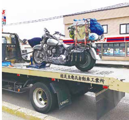
エンジン故障！レッカー車で函館へ

ていた北海道バイク旅に行っていました。私も今年で70歳。バイクもポンコツ化のため今回が最後の北海道キャンプツーリングになると思ひ、3週間程ゆっくり楽しもうと舞鶴港からフェリーで小樽港に向かいました。