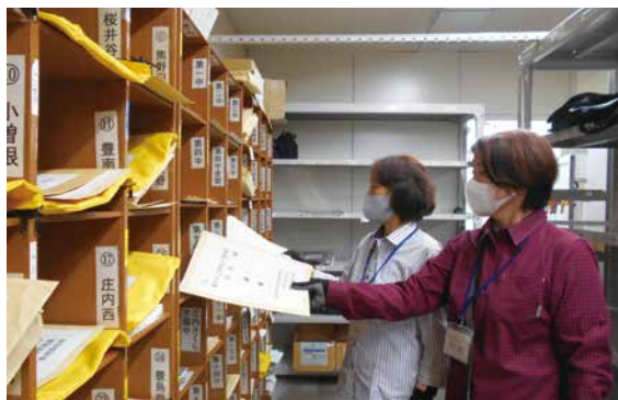
宛名ボックスに入れる

終るとボックスからカバンに入れる。おおよそ2時間位でこの作業を終えなくてはいけない。おしやべりの余裕などない。 冊子が塊のように入っていて重いカバンもある。宛先の文字がよく分からない。宛先のボックスが何処にあるか分からない。困ったときはお互いに助け合い、作業を進めています」 「阿吽の呼吸が大事」と言われていました。