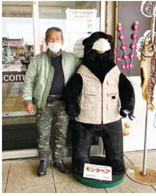
どちらが本人でしょう？

やっぱり北海道の広大な自然や美味しい食べものなど全てが感動ですが、それより今回は北海道の親切な方々に助けられ、温かく優しい人情に触れたことが何よりも素晴らしいです。また、機会があれば今度は車でチャレンジしてみたいなあ。