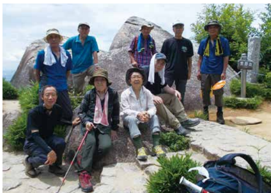
交野山山頂にて北摂の眺望を満喫

昨年(2022年)も、六甲山、中山、有馬富士。雨の中の生駒山、飛鳥などに参加しています。なかでも印象に残っているのは、交野山です。京阪の私市駅から、くろんど池を通りキャンプ場へと暑い中の緩やか登り進む。体じゅうの水分が出尽くした感じ。休憩を取る、しばらく緩やかな下りを進む、皆さんの安堵の顔が見られました。