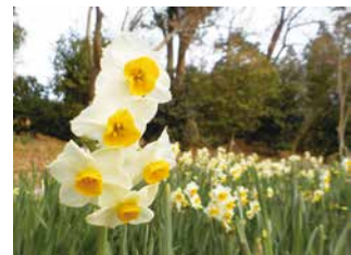
ニホンスイセン (2022年 1月)