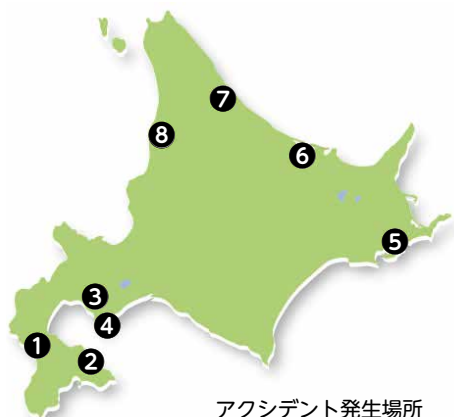
アクシデント発生場所

⑧ 稚内から日本海側を南下する途中、道路の段差で後のボックスが暴れ出す。よく見ると、リア側の留め具のネジが左右とも無い！何とか予備のネジを探してフエンダー下にもぐって応急処置。もし走行中外れたらと思うとゾツとする。