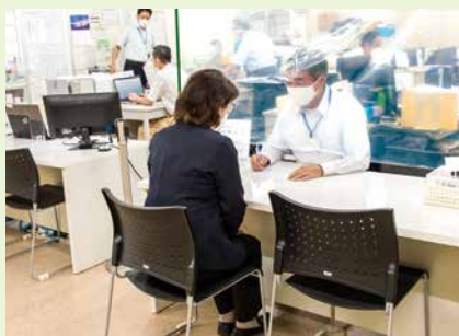
個別就業相談 〈庄内支所〉

センターには発注者から、たくさんの仕事の依頼が来ますが、希望者がおらずお断りをする場合が多くあります。希望と違う職種でも、是非チャレンジして下さい。また、事務局だよりに載せられないタイミングで出てくる、単発の仕事もあります。このような仕事の依頼があった場合、すぐにご連絡できるよう、登録していただく制度を作りました。興味をお持ちの方は、是非ご登録をお願いいたします。何か質問等ございましたら、お気軽に問合せ下さい。