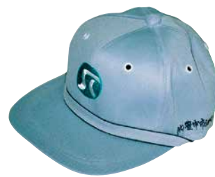
私は“ふれあい”帽子

今回は比較的新しく、2020年6月より豊中市から請負った「豊中市送達文書仕分け業務」の就業場所を取材しました。