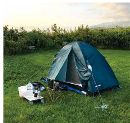
サンセットがきれいなせたなキャンプ場

5年ぶりの北の大地。やっぱり最高！と気持ちよく走っていた2日目に突然エンジンから聞いたことのない異音が発生！ロードサーブスのレッカーで函館のハーレーショップまで運んでもらい、無理をお願いして応急処置していただき、ひと安心。しかし、そのあと様々なアクシデントが起こることなど想像もしていませんでした。そのアクシデントを箇条書きでまとめました。