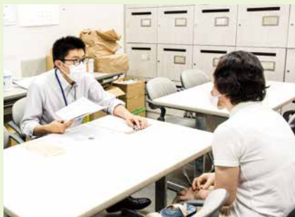
個別就業相談 〈本所〉

当日は、じっくりと相談や情報提供をできるように、相談要員として専属の事務局員を配置しております。お気軽にセンターへお越しください。 【事務局日より8月号より】