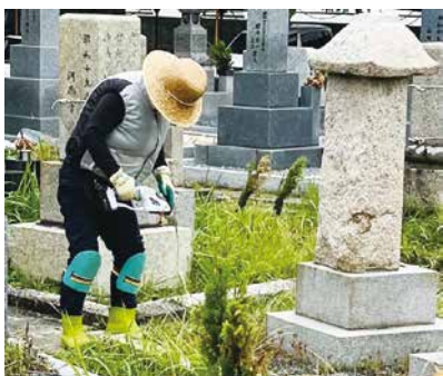
お墓掃除川柳 草引きも やってみたいな リモートで (ちゃっかり ITさん)

お墓掃除で、お悩みの方は安心。私たちが心を込めてサポートします。お掃除・供花・お線香をあげるなど、お墓参りの代行もご相談下さい。