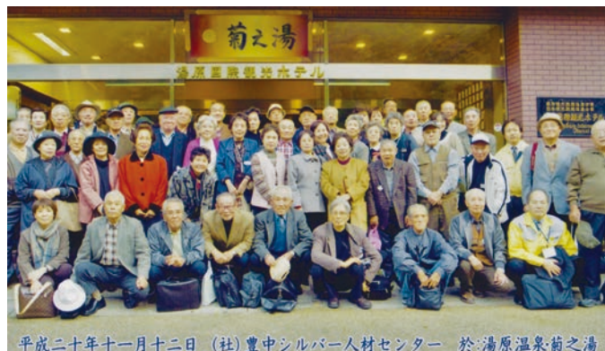
平成三十年十一月十二日 (社)豊中シルバー人材センター 於湯原温泉菊之湯