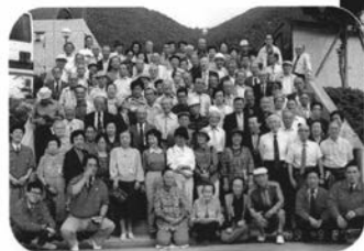
▲第3回 三木市丹波立杭陶の郷にて 平成元年9月27日