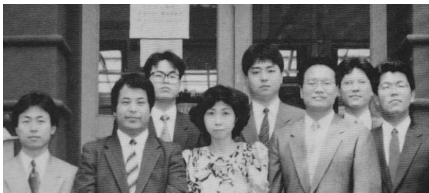
平成2年シルバー職員一同