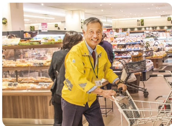
▲活躍される、シルバー人材センターのHさん。