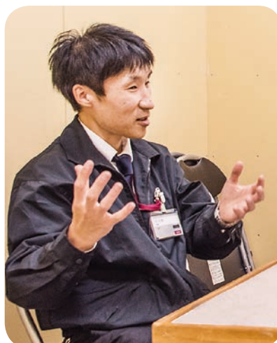
▲熱っぽく語られる、栗野店長さん。