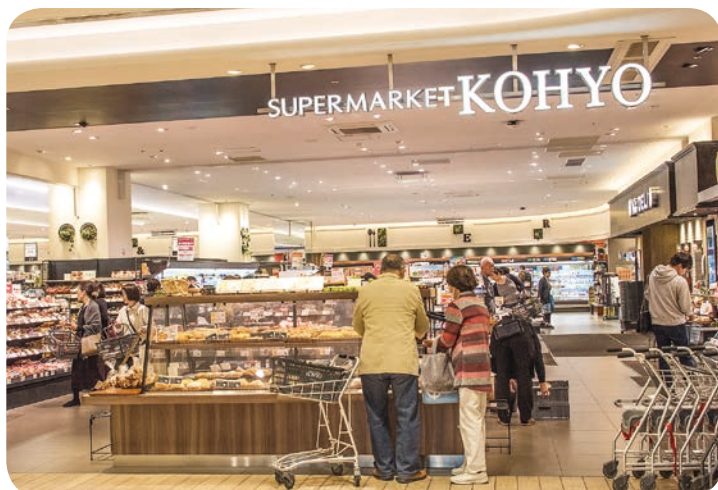
▲オシャレなお店。素敵な雰囲気が醸し出されています。