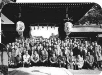
▲第2回 赤穂市大石神社にて 昭和63年11月25日