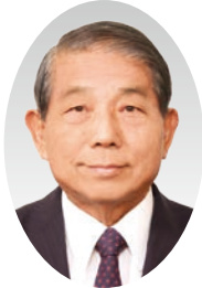
豊中市議会議長 喜多 正顕

旧年中は、豊中市政の推進に 格別のご尽力を賜り、厚くお礼 申しあげます。市長に就任して 初めて迎える新年にあたり、改 めて身も心も引き締まる思いで