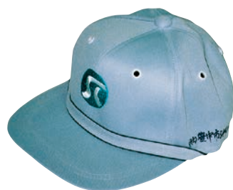
私は“ふれあい”帽子

名の会員さんから始められましたが、今は登録メンバー21名だそうです。先生はお若い頃から、編み物一筋に歩んで来られ、公益財団法人日本手芸普及協会の会員さんでもあります。また豊中市内外のカルチャースクールでも手編みの講師をされています。