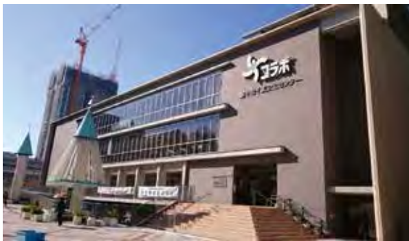
コラボ・写真左上は建設中のシエリアタワー

今、千里中央では、複合公共施設の千里文化センターコラボ（豊中市役所新千里出張所・千里図書館・千里介護予防センター・千里保健センター・千里公民館）が平成20年にオープンし、住民の生活に大きな便宜をもたらしている。