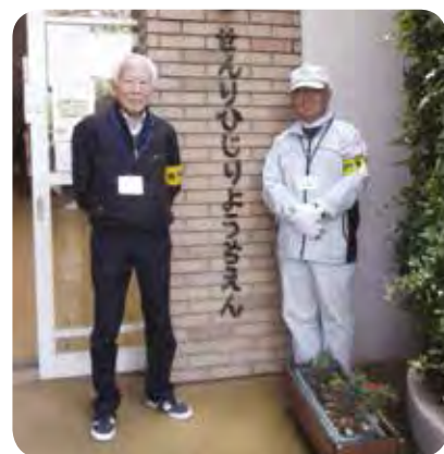
就業会員の皆さん