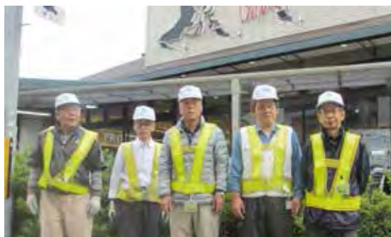
就業会員の皆さん