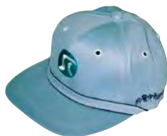
私は“ふれあい”帽子