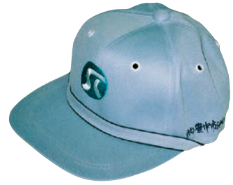
私は“ふれあい”帽子

今回の取材は、『ユーザーさんの声』と同じく「豊中あけぼの保育園」で就業されている女性会員にお聞きしました。