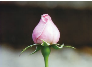
「中之島薔薇園」 第11班 荒賀 孝夫