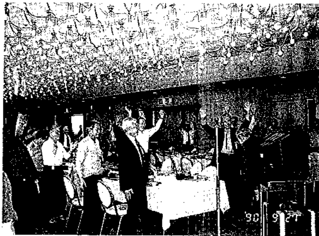
力を合せてガンバリましょう。 シルバーパンザイ!!