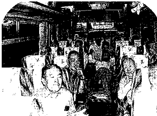
車中のど自慢大会風景