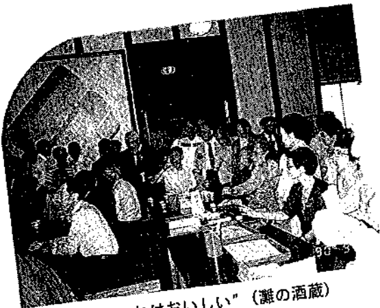
“これはおいしい” (灘の酒蔵)