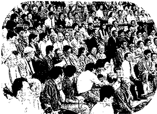
童心に帰った ひとときでした…