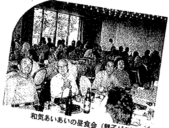
和気あいの屋食会 (舞子ピラ)